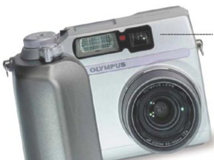
Digitalkamera för dokumentation av behandlingsresultat