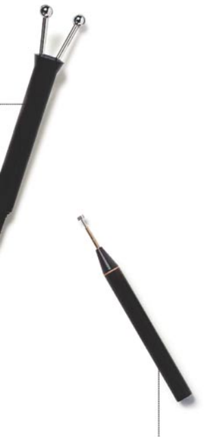
Sond med mjukt huvud för näsa, acne och ärr